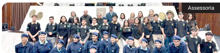
Estudantes visitaram o Palácio Iguaçu e Alep, onde também acompanharam a votação de projetos

A câmara municipal de Quedas do Iguaçu promoveu, na última segunda-feira (22), uma agenda institucional em Curitiba com vereadores mirins e integrantes do Parlamento Jovem. A atividade reuniu estudantes, educadores e representantes do Legislativo em visitas ao Palácio Iguaçu e à Assembleia Legislativa do Paraná (Alep).