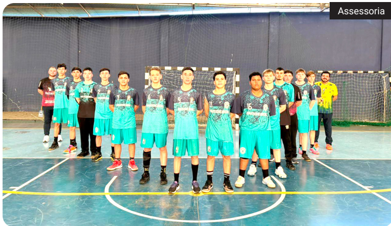
A equipe de handebol masculino sagrou-se campeã regional e encerrou um período sem troféus iniciado após a conquista do handebol feminino, em 2012

O desempenho das equipes evidencia a presença constante de Quedas do Iguaçu nos Jojups ao longo das últimas décadas.