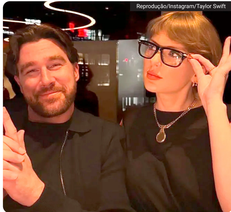
Taylor Swift e Travis Kelce assumiram o relacionamento em 2023. O noivado foi anunciado em agosto de 2025

Também circulam especulações sobre o local do evento, incluindo a possibilidade de uma celebração reservada em Nova York. Até o momento, representantes do casal não divulgaram informações sobre a programação ou os convidados da cerimônia.