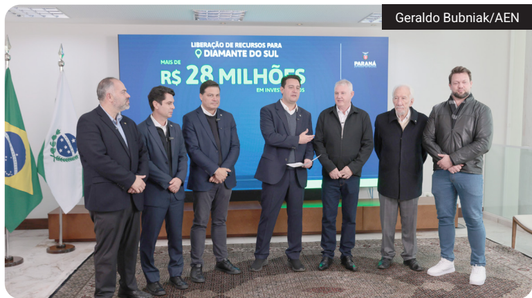
O prefeito Darci Tirelli e o deputado estadual Artagão Júnior estiveram presentes na cerimônia

Diamante do Sul foi contemplado com R$ 28,5 milhões em investimentos estaduais anunciados na última segunda-feira (22). Participaram do anúncio o prefeito Darci Tirelli, o deputado estadual Artagão Júnior, o governador Ratinho Junior, o presidente da Assembleia Legislativa, deputado estadual Alexandre Curi, entre outras lideranças estaduais.