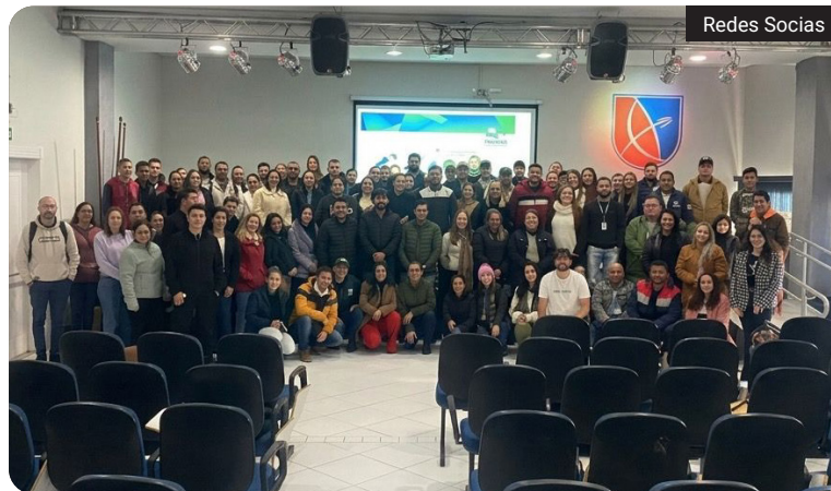
Treinamento reforçou ações de vigilância e controle da dengue, chikungunya e zika e atualizou práticas dos profissionais

Segundo a secretaria, a iniciativa faz parte do compromisso da prefeitura de Laranjeiras com a qualificação contínua dos servidores. De acordo com a administração municipal, investir na formação dos profissionais de saúde contribui para o fortalecimento da vigilância epidemiológica e para a proteção da população contra doenças de alto impacto social.