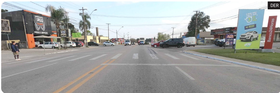
As intervenções incluem ainda uma passagem superior na altura da Rua Lauro Dromlewicz

Obra estimada em R$ 200,4 mi foi vencida pelo Consórcio Ivaí-Setep para duplicação de 4,52 kms da PR-417, entre Curitiba e Colombo