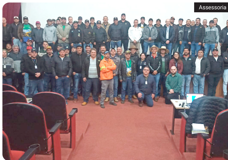
Durante a capacitação, os participantes receberam orientações práticas e teóricas sobre conservação de estradas e uso adequado dos recursos naturais

Servidores da secretaria de Viação dos municípios da Cantu participaram, em Laranjeiras do Sul, do curso 'Patrulheiros da Sustentabilidade', voltado à qualificação de profissionais que atuam na manutenção de estradas rurais e na operação de máquinas pesadas.