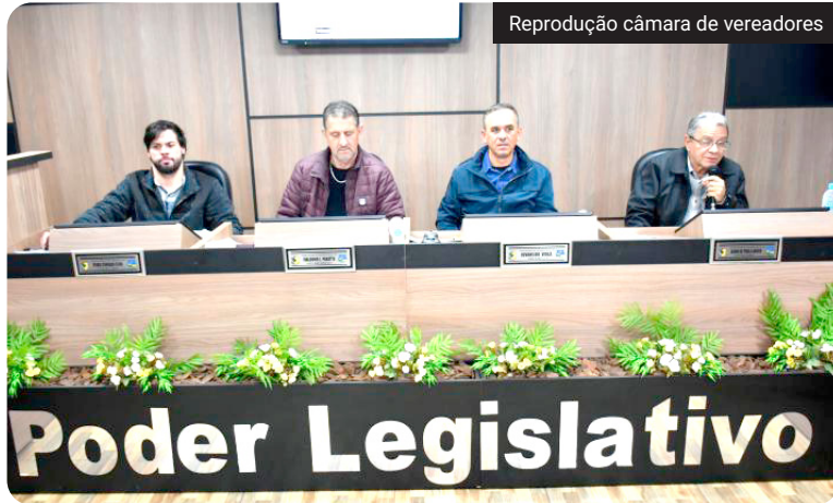
Sessão contou com análise de projetos voltados a diferentes áreas do município

No Pequeno Expediente, os vereadores receberam dois projetos enviados pelo Executivo. O primeiro prevê a revogação da Lei Municipal nº 065/2026, conhecida como 'Lei dos Postos de Combustíveis'. Já o segundo solicita a abertura de crédito adicional especial de R$ 150 mil para custear aluguel social destinado a famílias atingidas pelas obras de abertura da Avenida Álvaro Natel de Camargo, ligação viária que conectará o