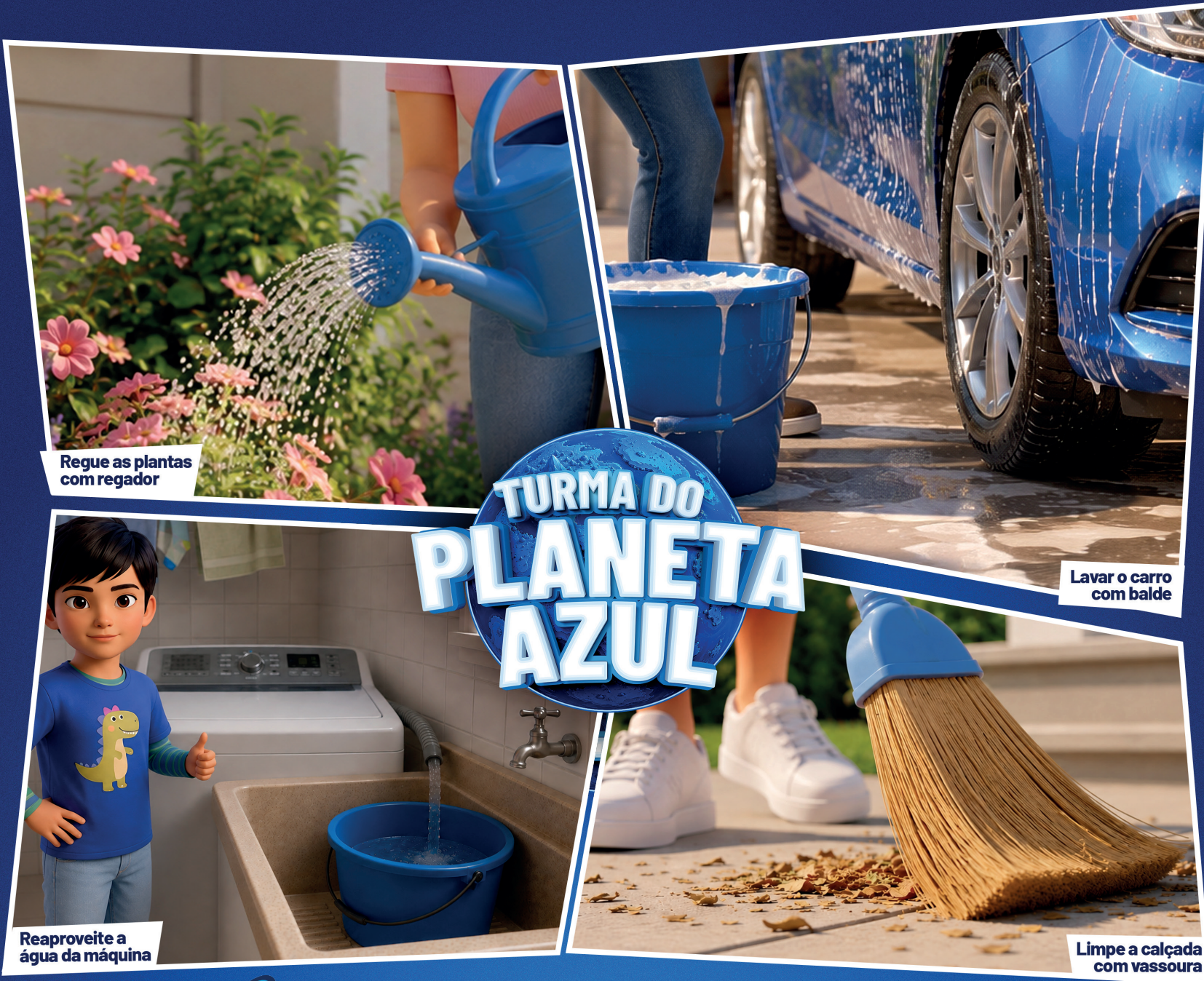
Regue as plantas com regador