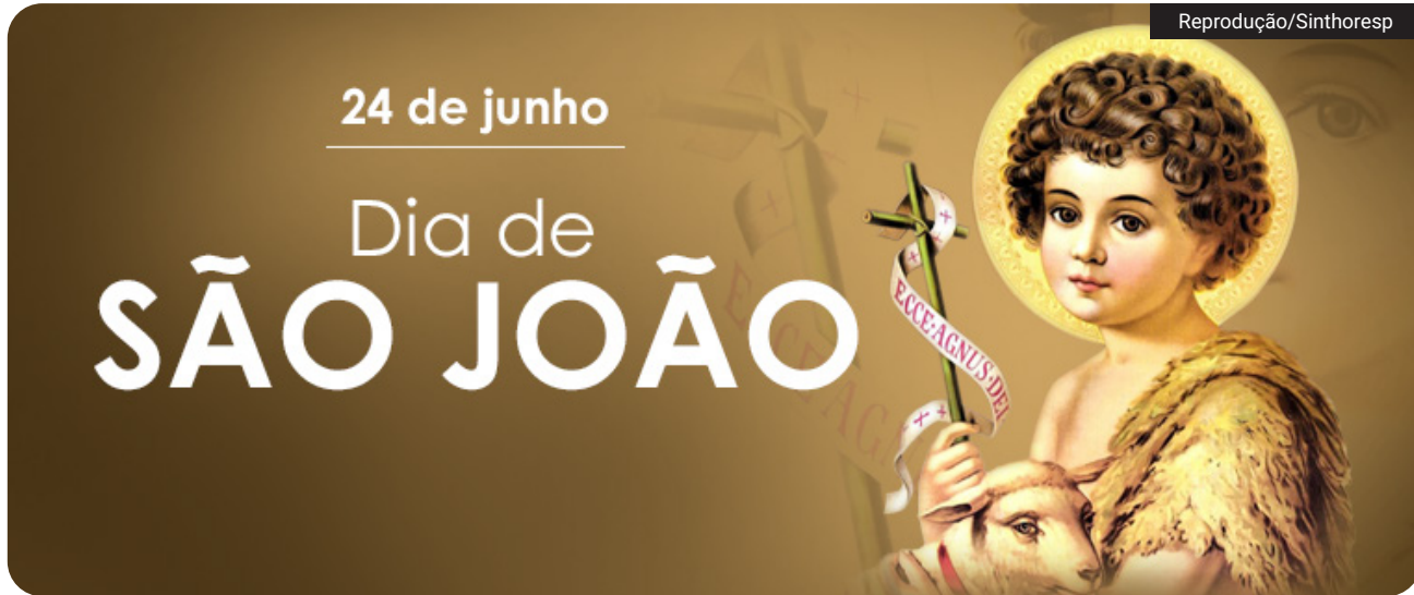
A escolha do dia 24 de junho está ligada à figura de São João Batista, personagem central da tradição cristã, responsável por batizar Jesus Cristo e anunciar a chegada do Messias

Dia de São João é dia de festa que une fé, história e cultura popular e mobiliza milhões de brasileiros todo 24 de junho