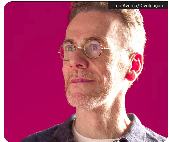
A estreia está marcada para 08 de agosto, em São Paulo, cidade natal do cantor e compositor

N ando Reis anunciou na última terça-feira (23) a turnê 'Pra você guardei o amor', que percorrerá 16 cidades brasileiras entre agosto e novembro. A estreia está marcada para 08 de agosto, em São Paulo, cidade natal do cantor e compositor. O encerramento do roteiro previsto ocorrerá em 20 de novembro, em Santa Maria, no Rio Grande do Sul.