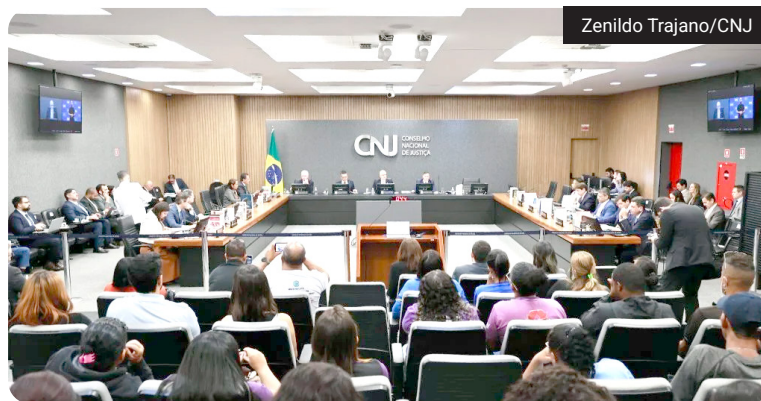
Relator no CNJ defende encerrar aposentadoria compulsória como punição a magistrados

Um relator do Conselho Nacional de Justiça (CNJ) defendeu o fim da aposentadoria compulsória como punição aplicada a magistrados no âmbito disciplinar, em discussão que envolve mudanças nas sanções da magistratura.