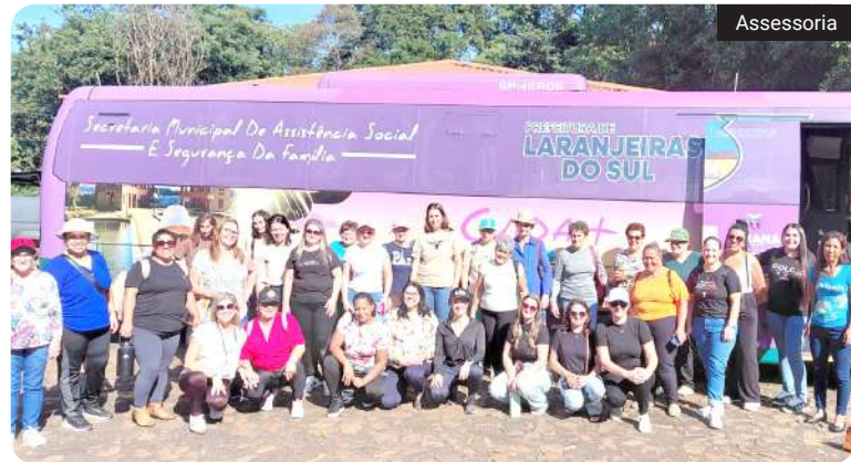
Grupo de Laranjeiras do Sul conheceu o Refúgio Bela Vista e trouxe 1,5 mil mudas de plantas medicinais para as comunidades

A iniciativa também integra ações de educação ambiental desenvolvidas em parceria com a Universidade Federal da Fronteira Sul. O objetivo é fortalecer o vínculo entre as participantes, suas comunidades