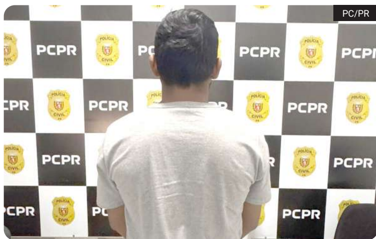
Homem investigado pela morte de uma mulher a facadas foi localizado após buscas

A Polícia Civil do Paraná, por meio da 2ª SDP de Laranjeiras do Sul, prendeu preventivamente um homem investigado pelo feminicídio de uma mulher morta a facadas na última segunda-feira (05) e mobilizou forças de segurança da região desde as primeiras horas após o ataque.