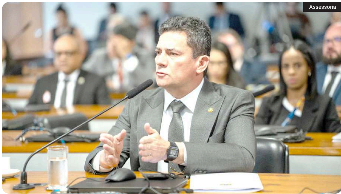
Sergio Moro, senador e pré-candidato ao Governo do Paraná pelo PL

A segunda vitória foi a derubada do veto presidencial ao projeto da dosimetria das penas. Isso é importante porque existe um sentimento de injustiça em relação a algumas condenações ligadas aos atos de 8 de janeiro. Eu visitei presos paranaenses, conversei com famílias e ouvi relatos que me marcaram profundamente, como o caso da Dona Sonia, uma senhora de Guarapuava, de 67 anos, presa e condenada a uma pena extremamente elevada, sem provas de que quebrou um copo