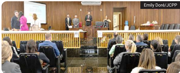
II Seminário Flor de Laranjeira realizado pelo Conselho da Comunidade sobre o combate à violência doméstica e apresentar os projetos voltados a ressocialização de PPL

Segundo o presidente do Conselho, o material será acompanhado de kits de leitura e folders educativos para conscientizar as famílias sobre a importância da reintegração social. “Essas pessoas que estão lá dentro querem uma oportunidade também. Muitas vezes é alguém estender a mão e dizer que elas têm uma chance