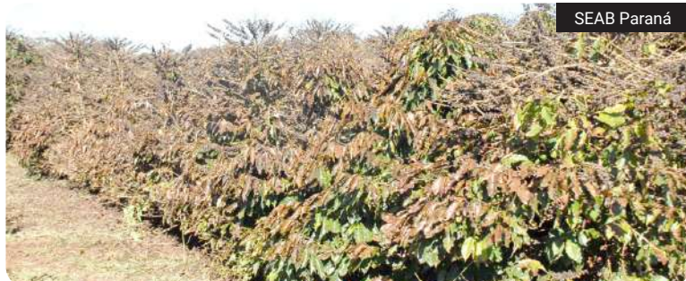
Serviço monitora risco de geadas e orienta produtores rurais durante o período de frio no Paraná

As equipes técnicas acompanham diariamente o avanço das massas de ar frio e elaboram boletins meteorológicos sobre as condições do tempo. Quando há previsão