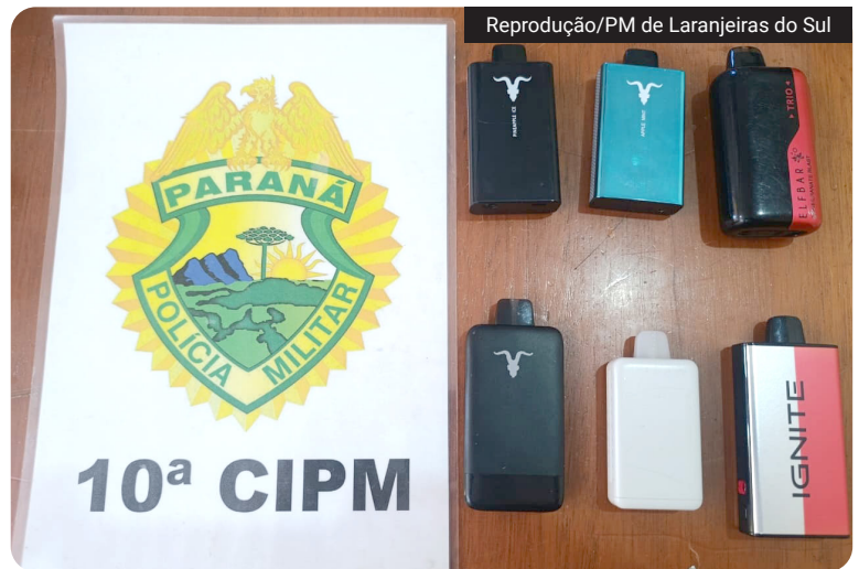
Parte dos adolescentes entregou espontaneamente os cigarros eletrônicos à direção da escola

A Polícia Militar encaminhou adolescentes à delegacia após uma ocorrência envolvendo o uso e a comercialização de cigarros eletrônicos em uma instituição de ensino de Goioxim. O caso foi registrado na última terça-feira (12), na região central do município.