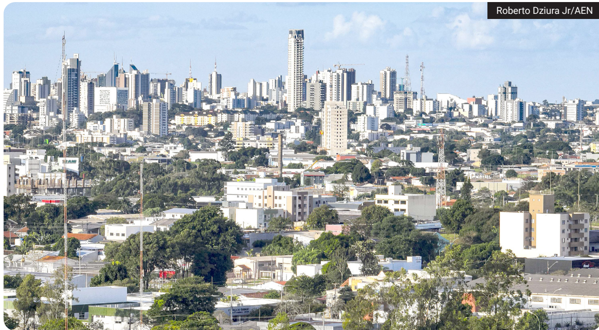
Roberto Dziura Jr/AEN

Paraná registrou queda na concentração de renda e avanço no rendimento das faixas mais pobres da população, segundo dados divulgados pelo IBGE