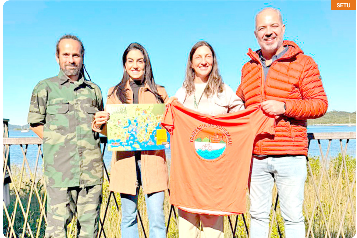
Representantes da SETU participam da Travessia do Superagui, no Litoral do Paraná

parte da Rota Turística Caminhos do Peabiru, programa que resgata antigos caminhos