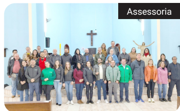
Representantes da comunidade Nossa Senhora do Perpétuo Socorro durante o lançamento oficial da programação da Quermesse 2026

Segundo a organização, a expectativa é ampliar a participação do público e fortalecer o vínculo entre escola, igreja e moradores do bairro. “Queremos celebrar a fé e também criar momentos de convivência para as famílias”, destacou a coordenação