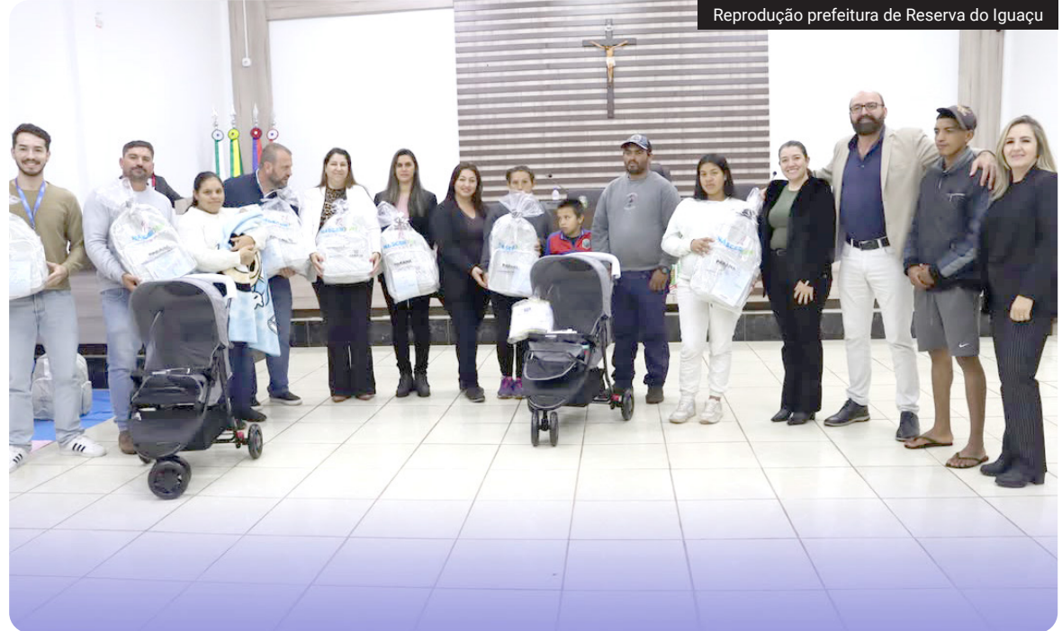
Reprodução prefeitura de Reserva do Iguaçu