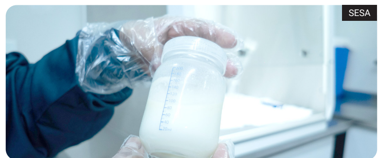
Atualmente, há 34 unidades da Rede de Bancos de Leite Humano, sendo 15 bancos e 19 postos de coleta. Entre janeiro e março deste ano, foram arrecadados 6,7 mil litros

A secretaria de Estado da Saúde reforçou nesta semana a importância da doação de leite humano no Paraná. A mobilização ocorre antes do 'Dia Mundial da Doação de Leite Humano', celebrado em 19 de maio.