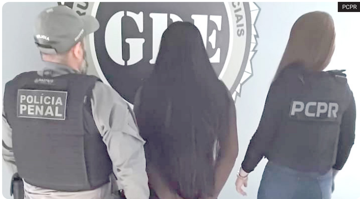
Suspeita foi localizada durante diligências realizadas pelas forças de segurança em Laranjeiras do Sul ontem (13)

Uma mulher investigada pelo crime de roubo foi presa na última quarta-feira (13) em Laranjeiras do Sul durante uma operação conjunta da Polícia Civil do Paraná e da Polícia Penal. O mandado de prisão foi cumprido após diligências realizadas pelas equipes de segurança no município.