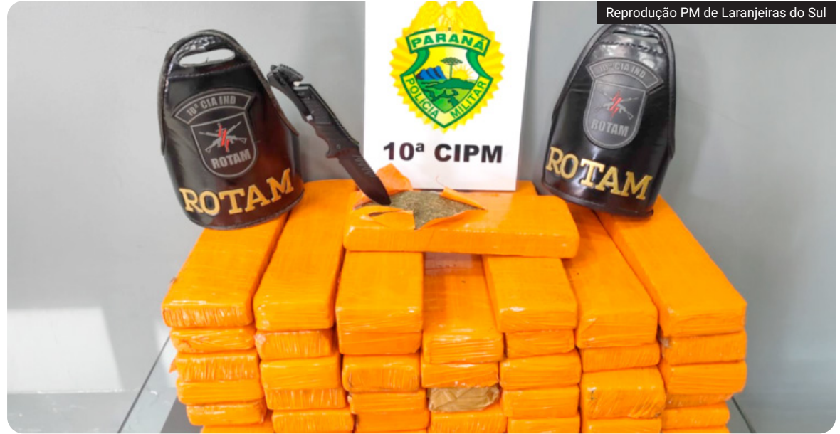
Durante a revista, os agentes encontraram 41 tabletes de substância análoga à maconha

A suspeita e a droga apreendida foram encaminhadas à delegacia para os procedimentos de polícia judiciária.