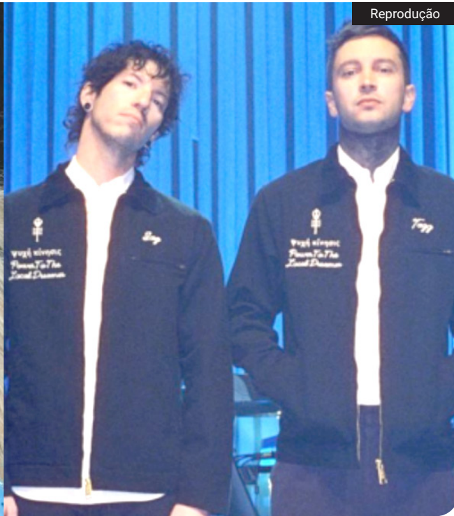
Zara Larsson se apresentará no Palco Sunset, enquanto a dupla Twenty One Pilots será a principal atração do Palco Mundo

O Rock in Rio confirmou na última terça-feira (12) novas atrações para o último dia da edição de 2026, marcada para setembro, no Parque Olímpico, no Rio de Janeiro. O duo americano Twenty One Pilots e a cantora sueca Zara Larsson foram anunciados para o dia 13 de setembro, encerramento do festival. Segundo a organização, os dois artistas farão apresentações únicas no Brasil durante o evento.