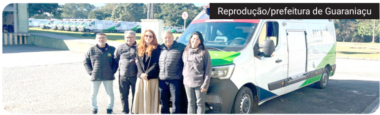
A entrega ocorreu em Curitiba com a presença do prefeito Ronaldo Cazella. Segundo a secretária de Saúde, Guaraniaçu foi o único município da 10ª Regional de Saúde de Cascavel contemplado

Guaraniaçu recebeu na última terça-feira (12) uma nova ambulância equipada como Unidade Avançada, semelhante a uma UTI móvel. O veículo foi entregue pelo Governo do estado, por meio da secretaria Estadual de Saúde, para reforçar o atendimento de urgência e emergência no município.