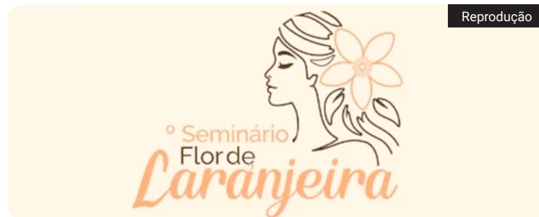
Iniciativa da comarca de Laranjeiras premiará projetos de prevenção e apoio às vítimas

Estão abertas as inscrições para o 2º Prêmio Flor de Laranjeira, promovido pelo Conselho da Comunidade da comarca de Laranjeiras. O prazo segue até 10 de julho.