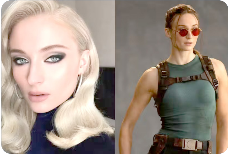
Sophie Turner protagoniza Lara Croft

Lara Croft é uma personagem que ganhou fama internacional com os videogames desde 1996 e foi adaptada para o cinema em duas ocasiões anteriores. No início dos anos 2000, Angelina Jolie viveu a arqueóloga nas telonas, e mais recentemente a atriz Alicia Vikander assumiu o papel em um filme de 2018.