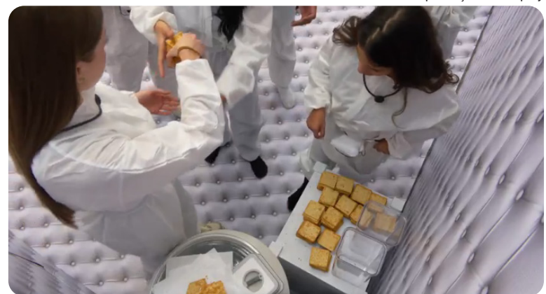
Os participantes do ‘Quarto Branco’ do ‘BBB 26’ estão há mais de 70 horas consumindo apenas biscoito cream cracker e água

Os participantes do ‘Quarto Branco’ do ‘BBB 26’ estão há mais de 70 horas consumindo apenas biscoito cream cracker e água. A prova de resistência vale três vagas no elenco do reality, mas impõe uma restrição alimentar que acende o alerta entre profissionais de saúde. Segundo a nutricionista Letícia Lenzi Claudino, esse tipo de dieta é pobre em proteínas e micronutrientes e rica em carboidratos simples e gorduras saturadas, o que provoca energia instável e fome constante.