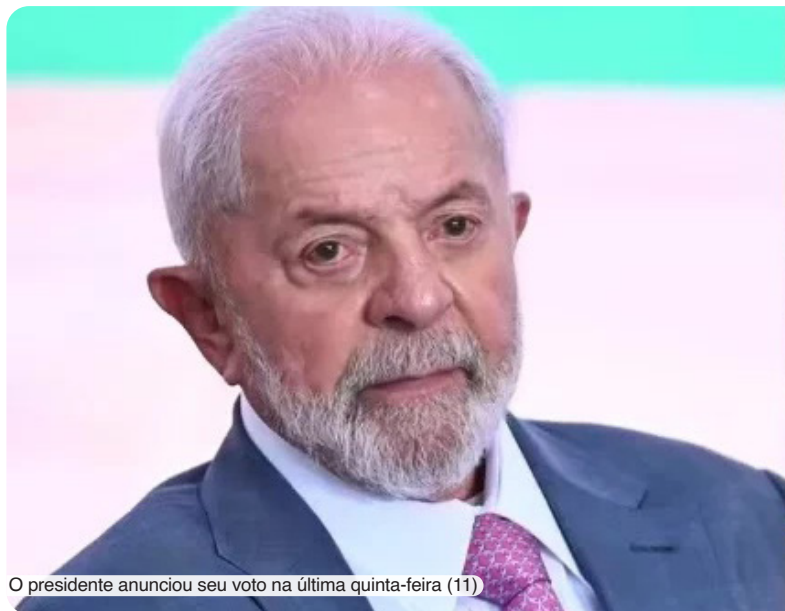
O presidente anunciou seu voto na última quinta-feira (11)

Antes do pronunciamento do ministro, Pacheco já havia indicado que o Congresso não concordaria com um eventual veto de Lula sobre o tema. "Há uma posição clara do Congresso Nacional em relação a essas saídas temporárias, que é um instituto que deve ser limitado, especialmente nos casos