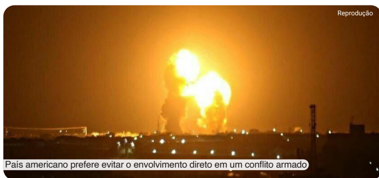
País americano prefere evitar o envolvimento direto em um conflito armado

Em um incidente relacionado, alegadamente aviões de guerra israelenses atacaram a embaixada do Irã em Damasco, resultando na promessa de vingança por parte do Irã. Durante o ataque, um general iraniano de alto escalão e seis outros oficiais militares iranianos foram mortos,