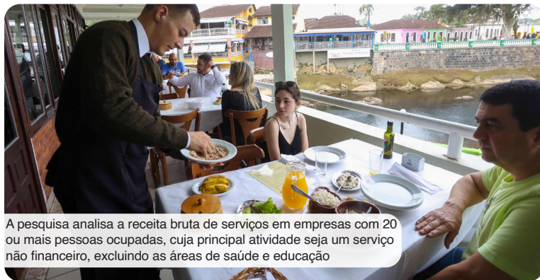
A pesquisa analisa a receita bruta de serviços em empresas com 20 ou mais pessoas ocupadas, cuja principal atividade seja um serviço não financeiro, excluindo as áreas de saúde e educação

As maiores altas foram observadas nas empresas que