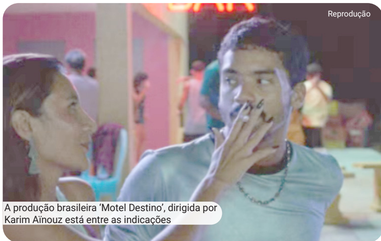
A produção brasileira 'Motel Destino', dirigida por Karim Aïnouz está entre as indicações

'O Cangaceiro', dirigido por Lima Barreto, garantiu o primeiro prêmio do Brasil no Festival de Cannes, em uma categoria que hoje não existe mais, a de filme de aventura. O enredo segue o Capitão Galdino,