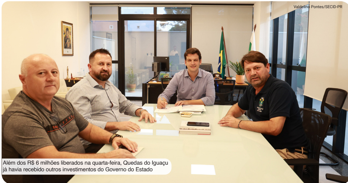
Além dos R$ 6 milhões liberados na quarta-feira, Quedas do Iguaçu já havia recebido outros investimentos do Governo do Estado

O secretário estadual das Cidades, Eduardo Pimentel, ressaltou a importância dos investimentos para Quedas do Iguaçu. "São recursos que ga-