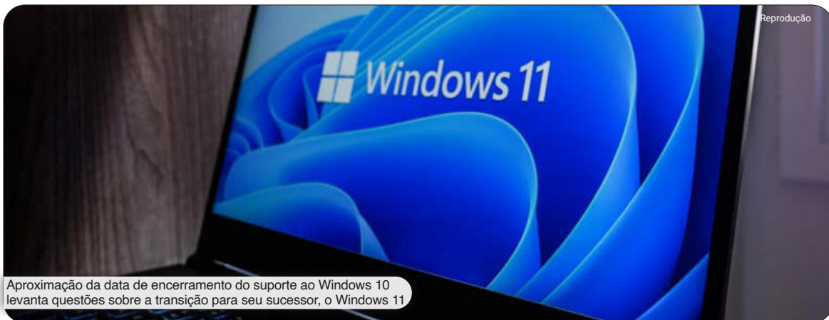
Aproximação da data de encerramento do suporte ao Windows 10 levanta questões sobre a transição para seu sucessor, o Windows 11

A Microsoft recentemente declarou que o suporte ao Windows 10 será finalizado em 13 de outubro de 2025, o que implica a cessação das atualizações de segurança e novos recursos para este sistema operacional, lançado em 2015. Entretanto, a empresa estendeu o período de suporte estendido para as versões Home e Pro do Windows 10, oferecendo mais tempo para os usuários considerarem a transição para o Windows 11, se assim desejarem.