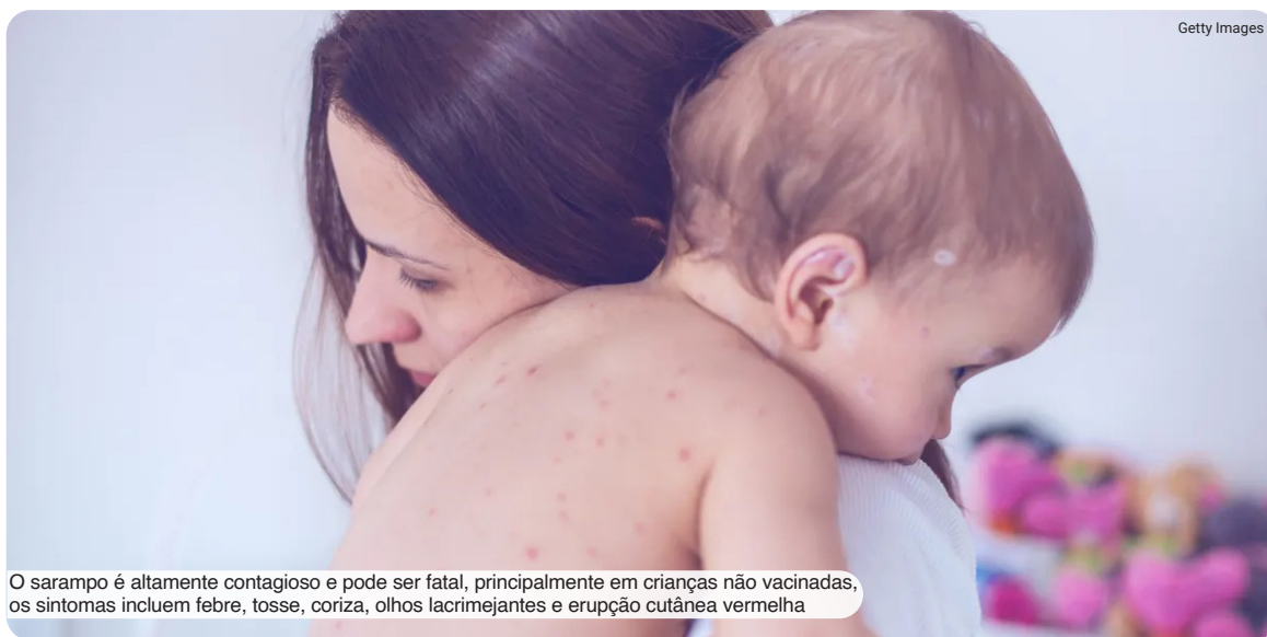
O sarampo é altamente contagioso e pode ser fatal, principalmente em crianças não vacinadas, os sintomas incluem febre, tosse, coriza, olhos lacrimejantes e erupção cutânea vermelha

O sarampo foi eliminado nos EUA em 2000, o que significa que não houve surtos persistentes por um ano ou mais. Segundo o relatório do CDC, a eliminação do sarampo "reduz o número de casos, mortes e