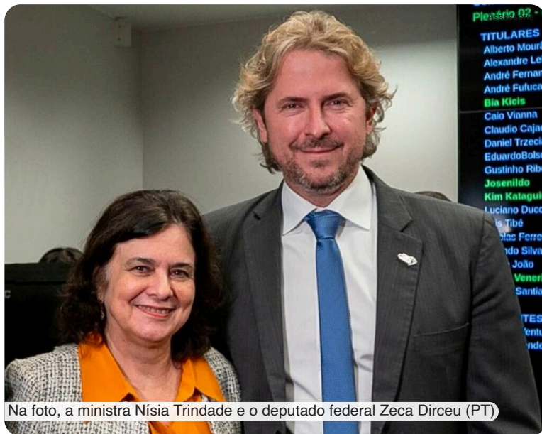
Na foto, a ministra Nísia Trindade e o deputado federal Zeca Dirceu (PT)

Casos recentes de hanseníase no Paraná totalizaram 415 em 2023. "Os recursos fornecidos pelo Ministério da Saúde serão