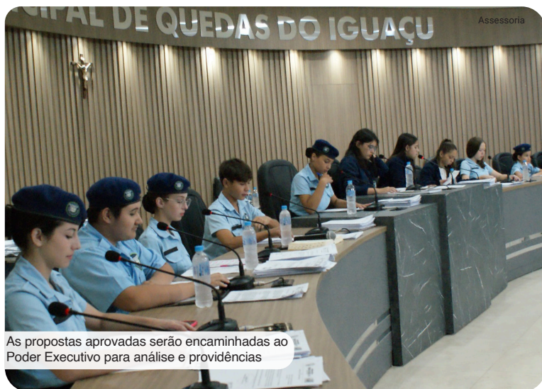
As propostas aprovadas serão encaminhadas ao Poder Executivo para análise e providências

No que diz respeito à infraestrutura, foi solicitada a construção de um trevo ou rotatória na PR 484, no trecho de acesso