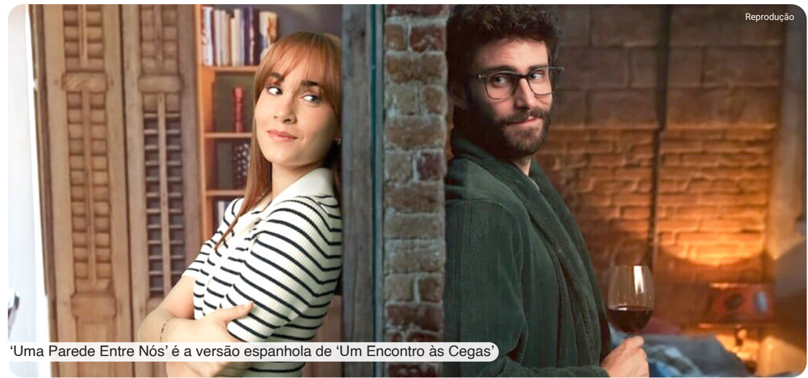
'Uma Parede Entre Nós' é a versão espanhola de 'Um Encontro às Cegas'

A trilha sonora original de 'Uma Parede Entre Nós' é