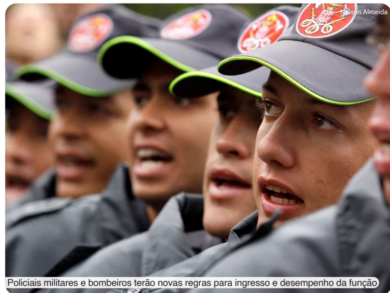
Polícia Militar e Bombeiros Militares terão novas regras para ingresso e desempenho da função

O Senado aprovou a Lei Orgânica das Polícias e Bombeiros Militares, que aguarda agora a decisão de sanção ou veto do presidente Luiz Inácio Lula da Silva.