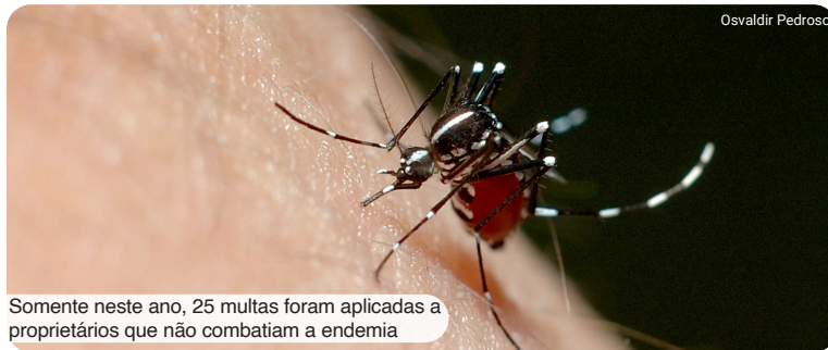
Somente neste ano, 25 multas foram aplicadas a proprietários que não combatiam a endemia

Cristo Rei: Março/23: 3.8% - Novembro/23: 0%