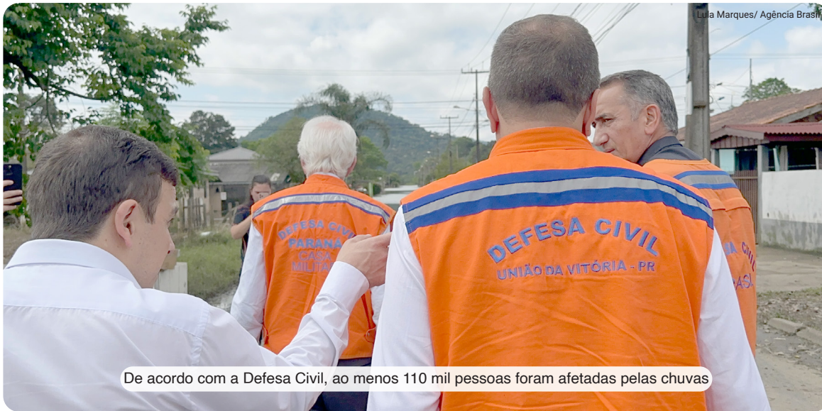
De acordo com a Defesa Civil, ao menos 110 mil pessoas foram afetadas pelas chuvas

“Desde o início o Governo Federal tem agido para amenizar os estragos. Seja através da Defesa Civil Nacional, do Exército Brasileiro, ou de ações dos ministérios, com a prorrogação de prazos para pagamento de tributos, liberação do FGTS, de kits de saúde e recursos. Tivemos agenda com ministros em Brasília e nos municípios, como em União da Vitória, onde estivemos com o ministro da Integração Regional, Waldez Góes. Nos reunimos com lideranças, com agricultores e empresários e realizamos visita técnica nas áreas alagadas. Par-