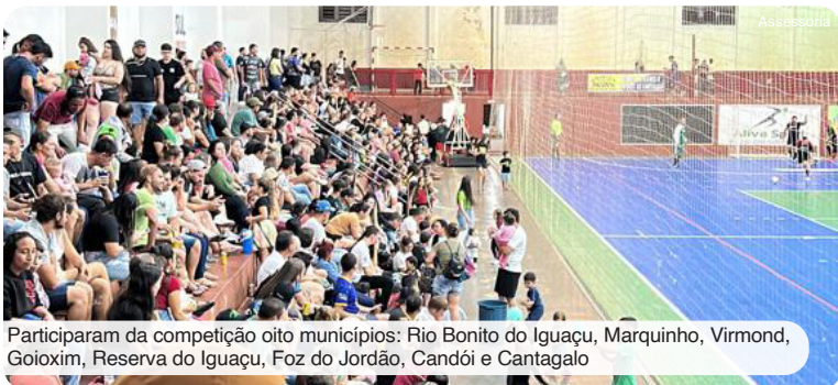
Participaram da competição oito municípios: Rio Bonito do Iguaçu, Marquinho, Virmond, Goioxim, Reserva do Iguaçu, Foz do Jordão, Cândoi e Cantagalo