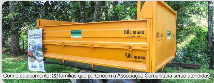
Com o equipamento, 22 famílias que pertencem a Associação Comunitária serão atendidas

Os produtores rurais da Colônia Santa Cruz têm disponível uma carreta basculante para auxiliar as atividades do campo. O equipamento, no valor de R$ 50 mil, foi entregue na última quarta-feira (08), pelo programa ‘Dinheiro Direto na Comunidade’. A iniciativa foi criada em uma parceria entre a prefeitura e a câmara de Laranjeiras do Sul, visando fortalecer as entidades de utilidade pública do município. O equipamento atenderá 22 famílias que compõem a Associação Comunitária da loca-