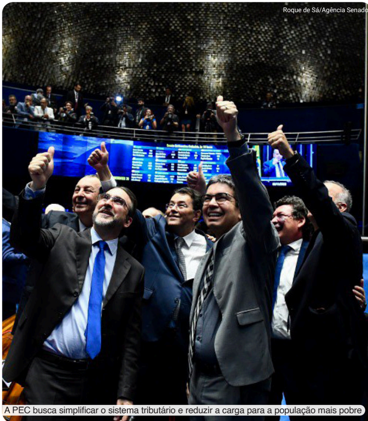
A PEC busca simplificar o sistema tributário e reduzir a carga para a população mais pobre

O relator, Eduardo Braga, incorporou mudanças propostas no Plenário, que recebeu cerca de 830 emendas. Um acordo garantiu a aprovação de uma emenda para criar um fundo de desenvolvimento para os estados da Região Norte. Líder do governo, Randolfe Rodrigues, destaca a historicidade da aprovação e a redução de tributos para a população mais pobre, com alíquota zero para itens da cesta básica. No entanto, senadores da oposição, como Rogerio Marinho, criticam a proposta, alegando aumento da carga tributária para a maioria. A PEC inclui o Imposto sobre Valor Agregado (IVA) e alíquotas diferenciadas para setores