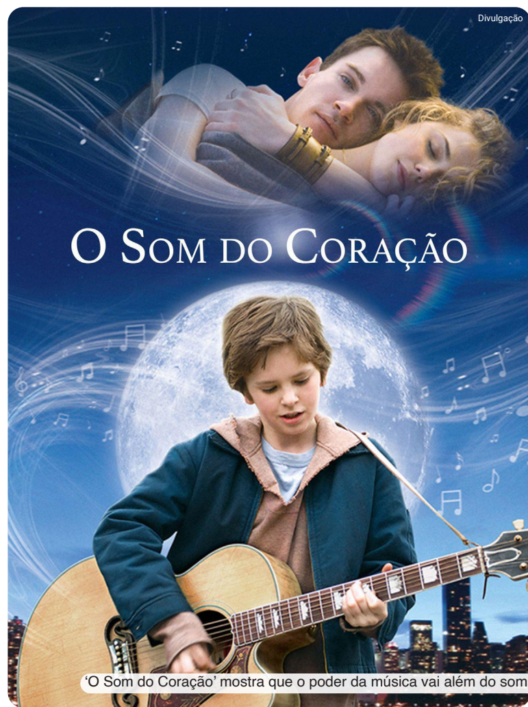
'O Som do Coração' mostra que o poder da música vai além do som

Dirigido por David O. Russell, 'O Lado Bom da Vida' não se concentra exclusivamente na surdez, mas incorpora esse tema de maneira significativa. A trama segue Pat Solitano, interpretado por Bradley Cooper, que, após passar um tempo em uma instituição mental, tenta reconstruir sua vida. Jennifer Lawrence, que interpreta Tiffany, uma jovem viúva, oferece uma performance impactante. O filme destaca as nuances emocionais da vida após experiências desafiadoras, incluindo a perda da audição, e como as relações interpessoais desempenham um papel crucial na superação desses obstáculos.