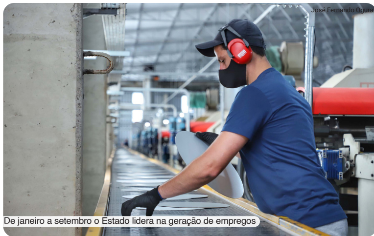
De janeiro a setembro o Estado lidera na geração de empregos