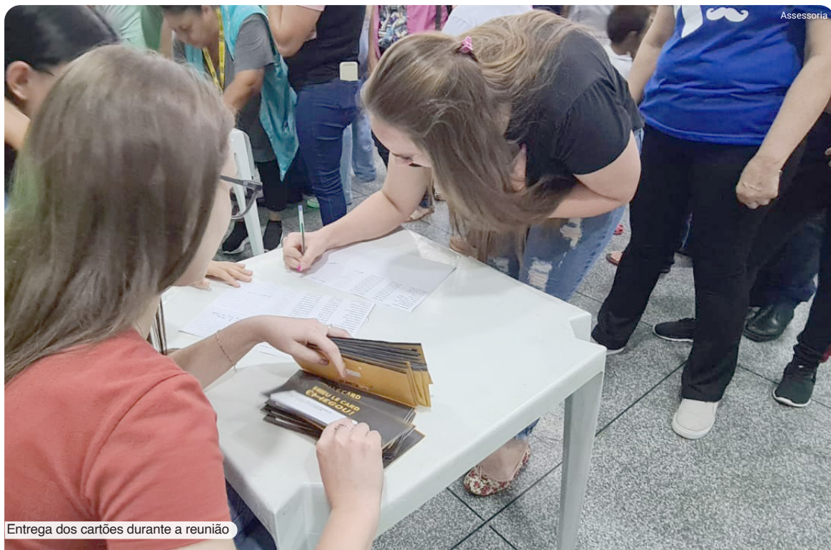
Entrega dos cartões durante a reunião

O prefeito Osmário Portela expressa contentamento, considerando-o uma grande vitória tanto para os funcionários quanto para o desenvolvimento geral da cidade e ressalta. "O vale alimentação representa mais uma evidência do nosso compromisso em reconhecer e valorizar nossos servidores, promovendo uma gestão eficiente e econômica. Além disso os salários e o 13º já estão separados e assegurados para pagamento, em