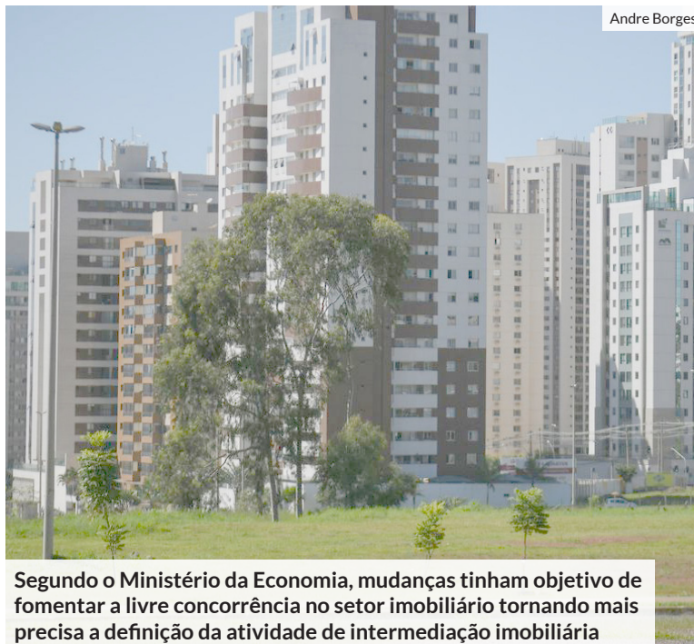
Segundo o Ministério da Economia, mudanças tinham objetivo de fomentar a livre concorrência no setor imobiliário tornando mais precisa a definição da atividade de intermediação imobiliária

Segundo o Ministério da Economia, as mudanças tinham o objetivo de fomentar a livre concorrência no setor de intermediação imobiliária tornando mais precisa a definição da atividade de intermediação