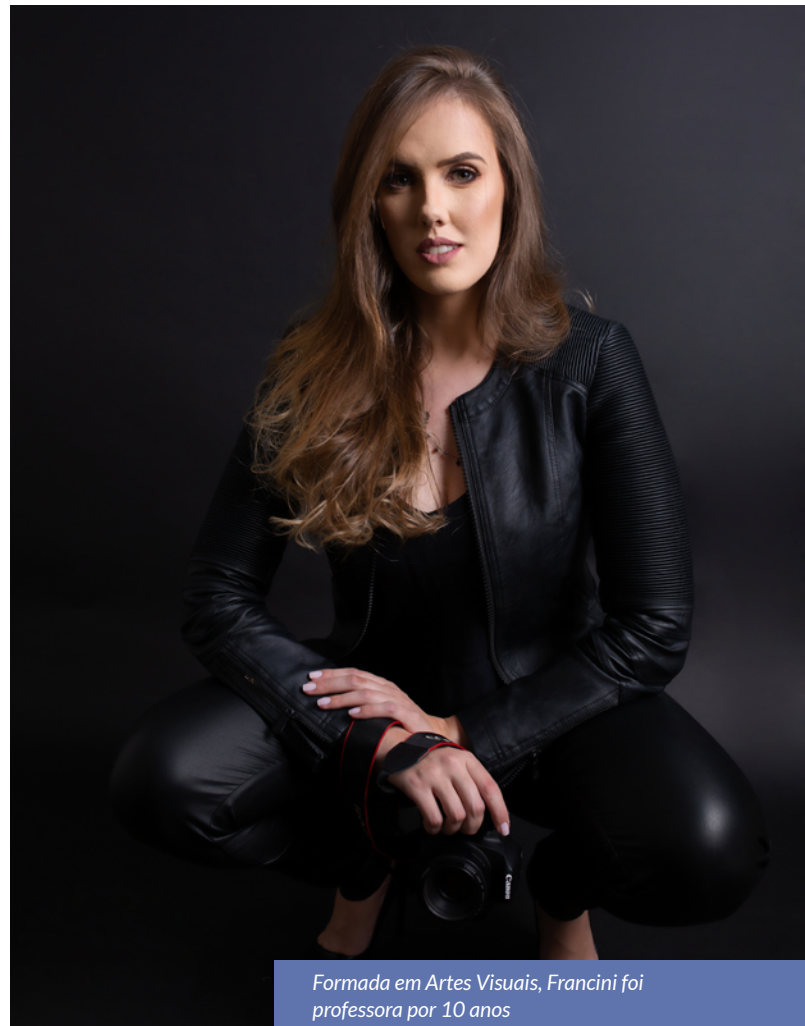
Formada em Artes Visuais, Francini foi professora por 10 anos

Na visão da fotógrafa independente da função que a mesma exerça na sociedade ela é muito cobrada para que possa dar conta de “tudo”, desempenhando um bom trabalho seja ele no âmbito profissional ou familiar. Contudo, cada vez mais ela vem conquistando seu espaço e seu reconhecimento. São muitos ainda os desafios que precisam ser enfrentados, mas a mulher tem em sua essência a força, a determinação e o carisma necessários para mudar o mundo, nunca esquecendo “Que a valorização da mulher começa dentro de cada uma de nós”.