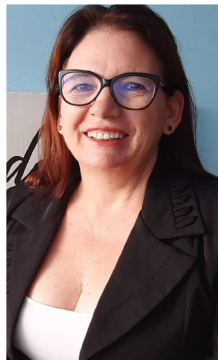
Formada em Pedagogia, Administração Pública e pós graduada em Psicopedagogia, Educação Especial e Didática do Ensino Superior