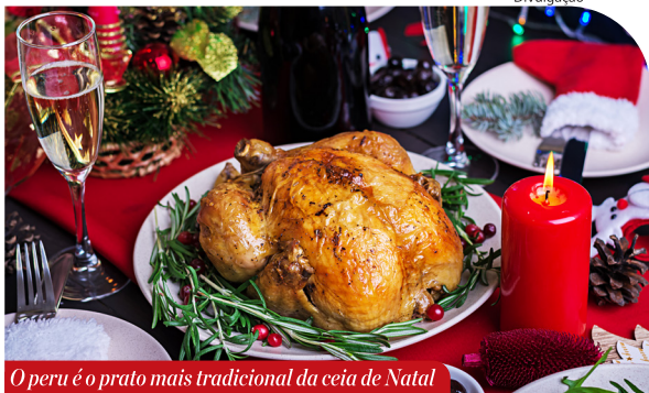
O peru é o prato mais tradicional da ceia de Natal